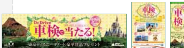
フェア参加Dr.Drive店は上記横断幕・ポスターのぼりが目印です。

【個人情報の取り扱いについて】 ●ご応募いただいた方の個人情報は、弊社及び弊社が指定する業務委託先で厳重に管理し、第三者に開示・提供することはありません。(法令などにより開示を求められた場合を除く)●ご応募いただいた方のご住所やお名前は、本フェアの賞品の発送にのみ使用いたします。