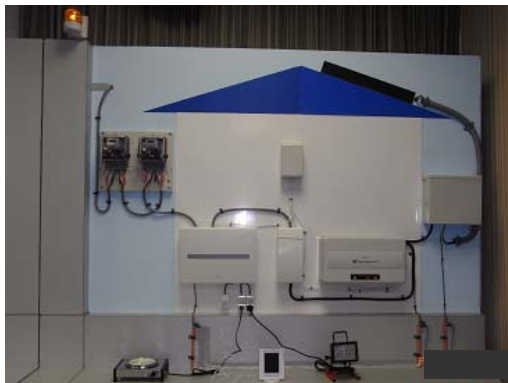
システム構成機器の展示台